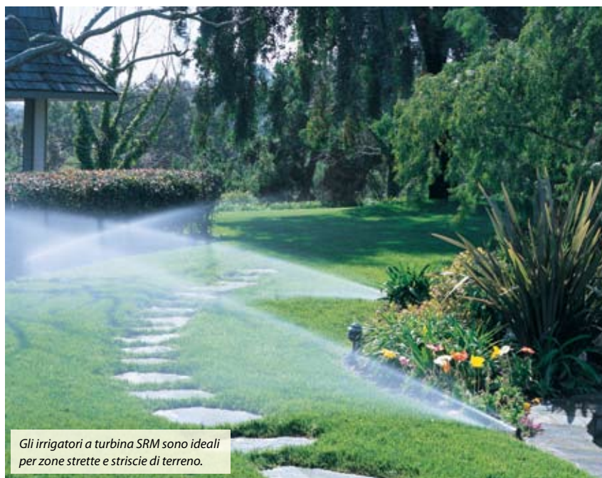
Gli irrigatori a turbina SRM sono ideali per zone strette e strisce di terreno.