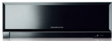
MSZ-EF VEB - Nero