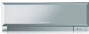
MSZ-EF VES - Silver