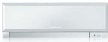
MSZ-EF VEW - Bianco