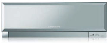
MSZ-EF VES - Silver