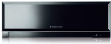
MSZ-EF VEB - Nero