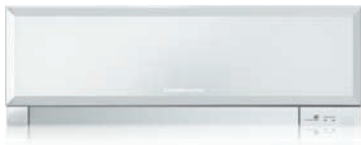
MSZ-EF VEW - Bianco