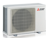
MXZ-2F33VF - MXZ-2F42VF - MXZ-2F53VF