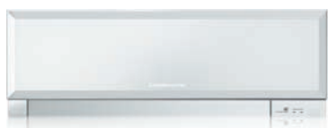
MSZ-EF VEW - Bianco