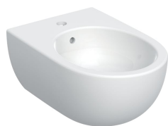
Figura di esempio