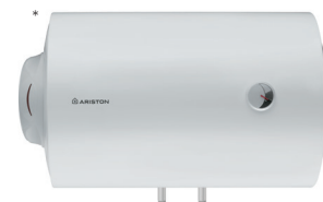
HTD (per HTS attacchi serpentino a sinistra)